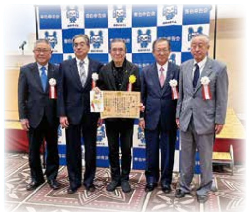
マスコットキャラクター表彰式

の記念講演を拝聴しました。コロナ空けの4年ぶりのブロック大会でしたが、北陸3県の役員並びに会員210名が参加し盛況裡に終了いたしました。