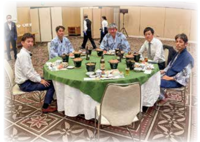
北陸ブロック大会 (10月12日・13日)

10月には北陸ブロック大会が富山で数年ぶりに開催され、北陸三県の会員同士の親睦も久しぶりに深めることが出