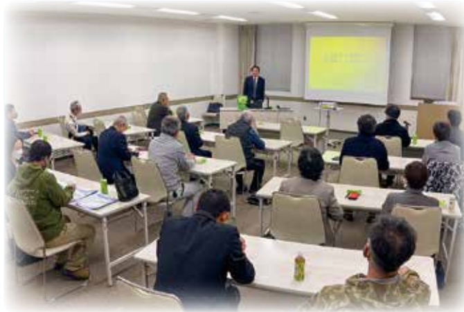
税務署長講話 (11月15日)

講師をお招きしての勉強会も、3月例会は人材採用について、8月例会は業務自動化の取組みについて、9月例会はインボイスについて、11月例会では税務署長の講話をいただきました。全ての例会を対面で行うことができ嬉しく思います。